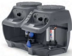
SAR 550 (litres)