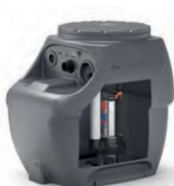
SAR 250 (litres)